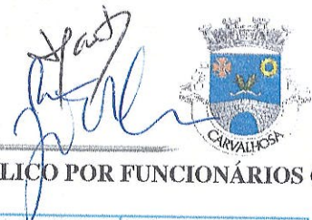
TABELA DE TAXAS E LICENÇAS PELA PRESTAÇÃO DE SERVIÇOS AO PÚBLICO POR FUNCIONÁRIOS OU ELEMENTOS DA JUNTA DE FREGUESIA